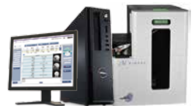
MDS-3410 with PC