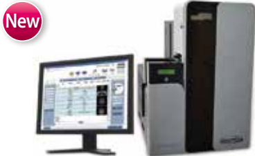
CATALYST 6000N (PC内蔵)